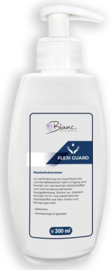
Art. Nr.: MF-FG300-BLA